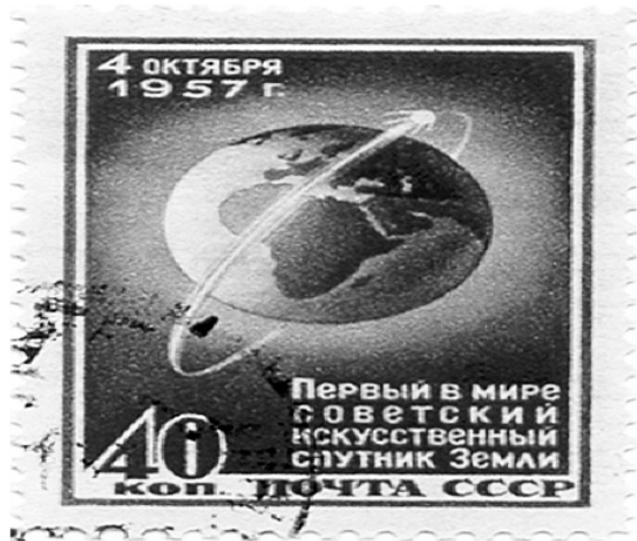
Slika 4: Sovjetska poštanska markica posvećena satelitu Sputnjik

Ministarstva odbrane SAD. Nažalost, ovi radovi su bili prilično aspraktni i nedostajala im je empirijska provera. Većina podataka o nuklearnim sposobnostima bila je poverljiva, a osim napada na Hirošimu i Nagasaki 1945. godine, nije bilo istorijskog iskustva u odnosu na koje bi se vršile teorijske generalizacije.