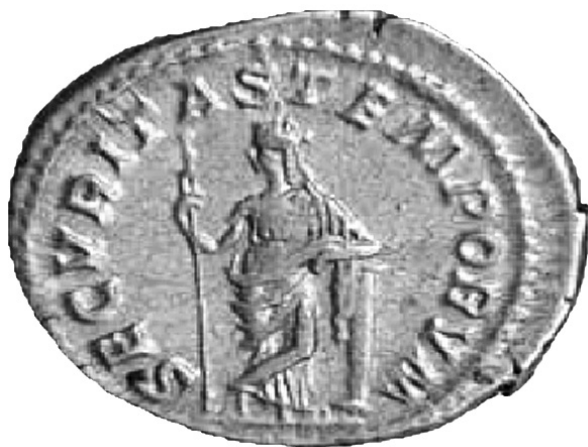
Slika 1: Dinar iz doba Marka Opelija Makrina (217–218)

a u političkom pogledu, to je nastojalo da postigne Sveto rimsko carstvo. Pored sukoba sa papstvom, carstvo je moralo da se nosi sa brojnim i sve moćnijim kraljevima i njihovim vazalima. [10] Reformacija je dovela u pitanje vrhovnu duhovnu vlast crkve, što je intenziviralo bezbednosnu dilemu na svim nivoima, od pojedinca pa sve do papstva. Počev od 16. veka, pojam bezbednosti vezuje se za javnu bezbednost (lat. securitas publica ), koja se odnosila na zaštitu podanika u miru, kao i na podršku podanika vladaru tokom rata. Verski građanski ratovi koji su u prvoj polovini 17. veka besneli Evropom iznedrili su ideju o tome da o bezbednosti pojedinca može brinuti samo suverena država.