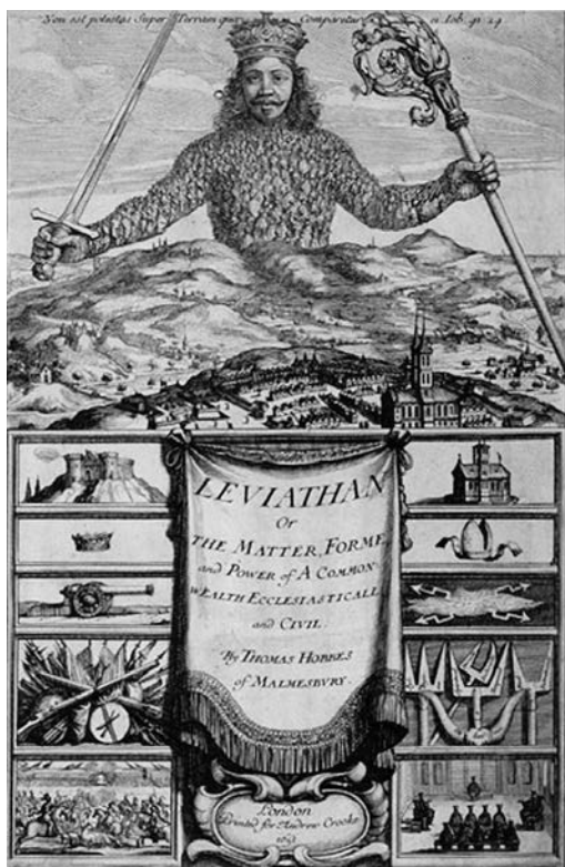
Slika 3: Ilustracija iz prvog izdanja knjige Levijatan iz 1651.

kako od drugih podanika, tako i od drugih država. Inspirisan verskim i građanskim sukobima sedamnaestovekovne Engleske, Tomas Hobs je ukazao na to da je individualna bezbednosna dilema elementarni ljudski problem. Jedini način da se prevaziđu ova individualna bezbednosna dilema i stanje anarhije među pojedincima jeste, prema njegovom mišljenju, u stvaranju zajedničke, mnogo veće sile, koja će brinuti o tome da svi pojedinci unutar jedne političke zajednice budu bezbedni. Ta ustanova kolektivne bezbednosti između pojedinaca, jeste država. Tako je, pomalo paradoksalno, jedan od utemeljivača realističke misli postao prvi teoretičar kolektivne bezbednosti. Uspostavljanjem države, problem anarhije i prirodnog stanja nije, međutim, u potpunosti prevaziđen. On je samo sa nivoa „pojedinaca“ gde je prevaziđen stvaranjem države, premešten na međudržavni nivo. Trebaće da prođe nekoliko vekova pre nego što će se sa stvaranjem Društva naroda rešenje za ovaj problem potražiti opet u logici kolektivne bezbednosti.